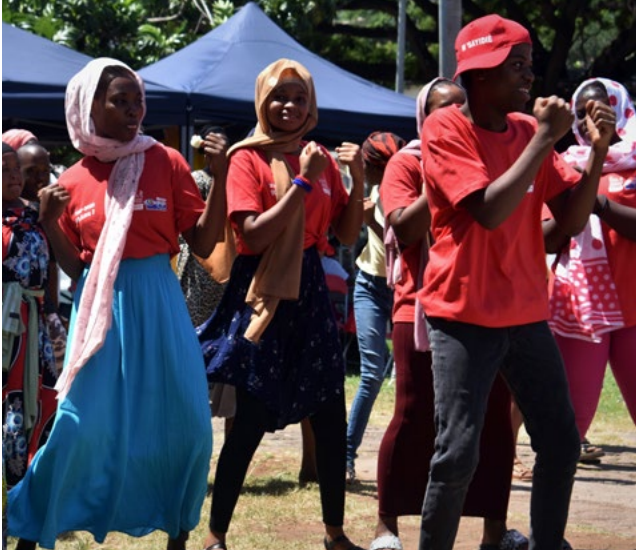
Les Apprentis d'Auteuil Mayotte, lauréat 2023