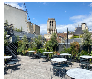
TERRASSE AVEC VUE SUR NOTRE-DAME DE PARIS