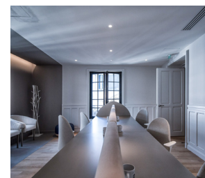
6 BUREAUX PRIVÉS

POUR TOUTE DEMANDE D'INFORMATIONS SUR NOS ESPACES, CONTACTEZ-NOUS SUR : privatisations@philanthro-lab.org