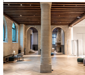
SALLE DES COLONNES