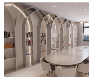
4 SALLES DE RÉUNION